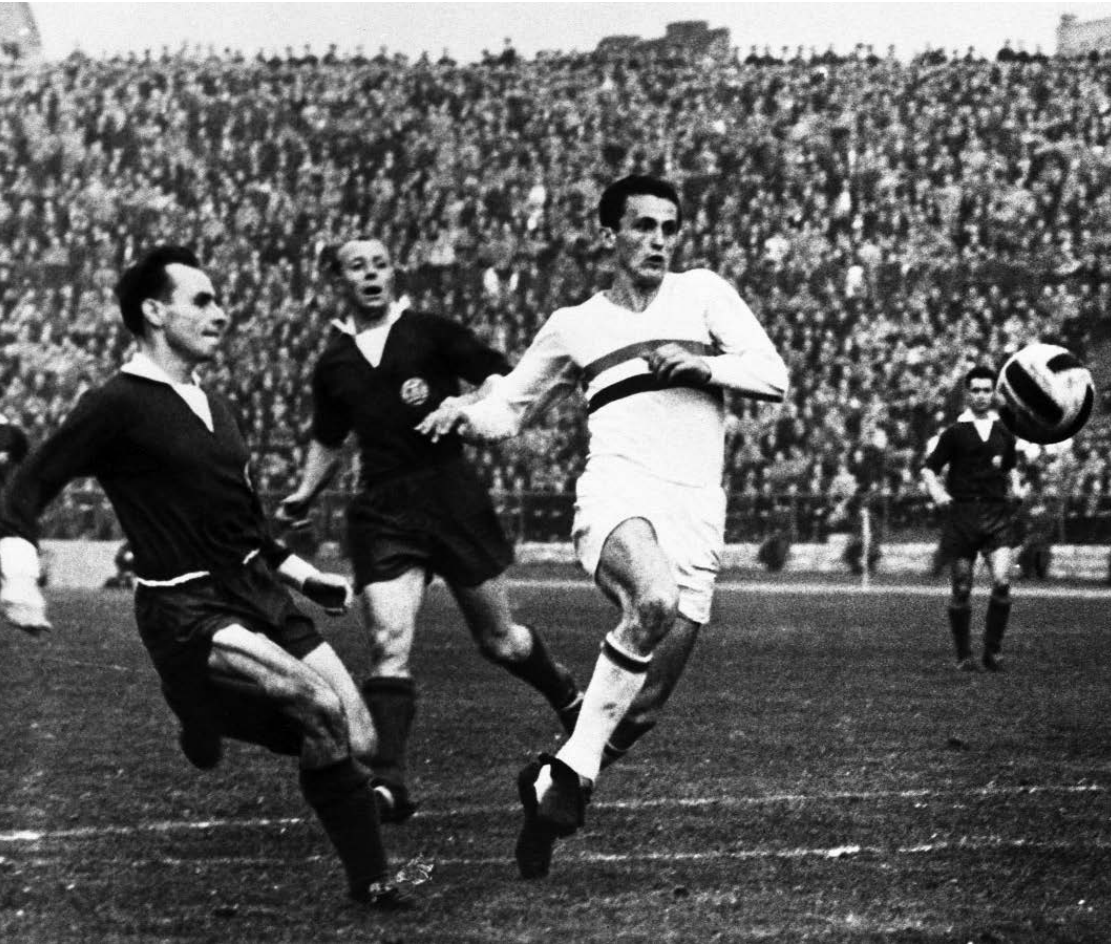
Albert Flórián (1941–2011), aranylabdás labdarúgó, a Nemzet Sportolója (Erzsébetváros Díszpolgára, posztumusz, 2012.)