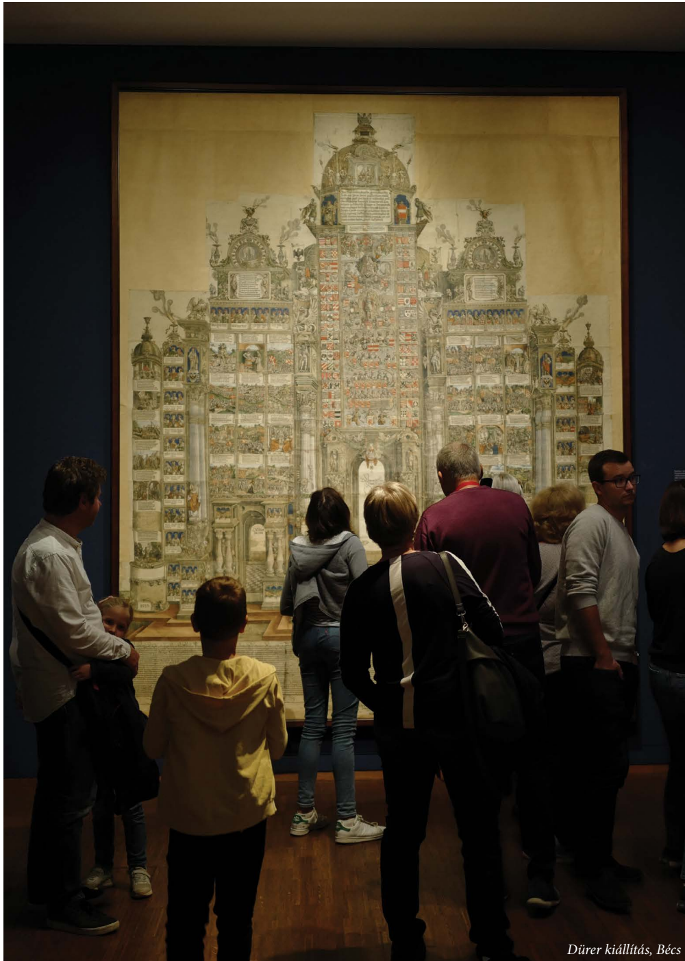
Dürer kiállítás, Bécs