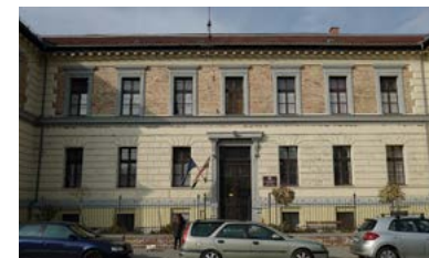
Volt Protestáns Országos Árvaház, ma a Magyarországi Evangélikus Egyház Budapesti Kollégiuma