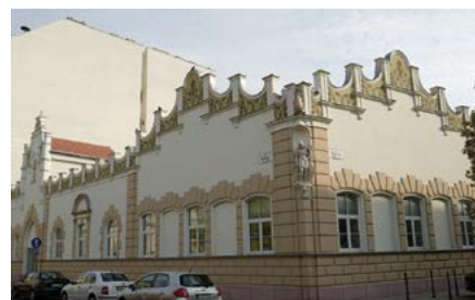
A Monarchia első izzógyárából lett sórraktár, ami ma Európa legnagyobb világi buddhista központja