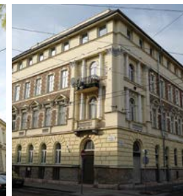
Az Izabella és a Dohány utca sarkán álló lakóház, emelet ráépítéssel...