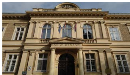
A volt Óvónőképző Intézet