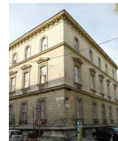
Volt szegényház, ma Erzsébet kórház