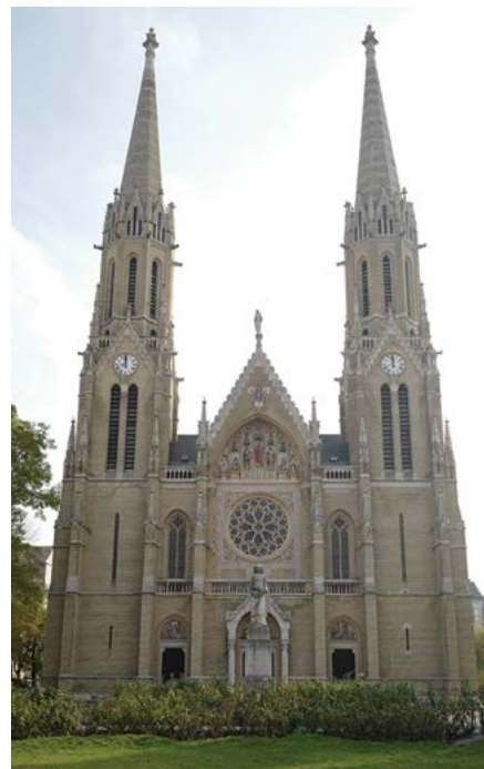
Az Árpád-házi Szent Erzsébet-plébániatemplom

Ha azt gondoljuk, ismerjük Erzsébetváros minden szegletét, sétáljunk csak körbe a Rózsák terén. Meg fogunk lepődni, mennyi érdekességet rejt ez a nyugodt kis hely.