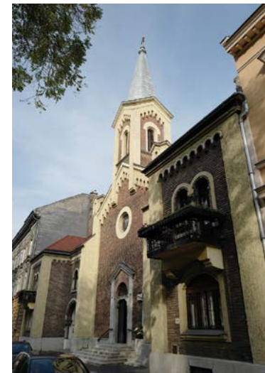
A görög katolikus templom