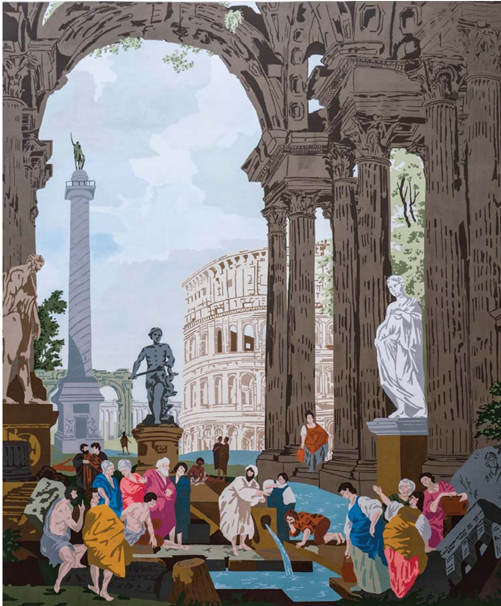
Ez a nemrégiben elkészült - nyolcvan négyzetméteres - falfestmény, a Facultas Humán Gimnázium udvarán található tűzfalat díszíti.