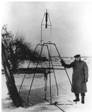
Robert Goddard építette a világ első folyékony hajtóanyagú rakétáját

Németország a második világháború során hatalmas eredményeket ért el a folyékony hajtóanyagú rakéták fejlesztésében. 1943-ban egy V-2 rakéta elérte a Kármán Tódor által meghatározott 100 km-es magasságot, vagyis kijutott a világűrbe. A háborút követően a német rakétafejlesztő mérnökök egy csoportja Amerikába került, míg egy másik csoportot a Szovjetunió ejtett hadifogságba. E két helyen indult nagyméretű katonai rakétafejlesztési program. A katonai fejlesztések mellett a világűr elérését is célul tűzték ki, mintegy a hidegháború eszközeként. Ennek jegyében Dwight D. Eisenhower amerikai elnök jelentette be 1957-ben, hogy a nemzetközi geofizikai év tudományos rendezvény- és kísérletsorozat keretében műholdat bocsátanak fel. A Szovjetunió eközben titokban folytatta a maga programját Szergej Koroljov vezetésével, a hadsereg égisze alatt. 1957. október 4-én egy továbbfejlesztett R-7 típusú interkontinentális ballisztikus rakétával a Szovjetunióban Föld körüli pályára állították a Szputnyik-1 műholdat, a világ első űreszközét. 1957. november 4-én pedig egy sokkal