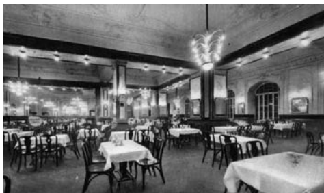
A szecesszió jegyeit mutató Ostende Kávéház (Rákóczi út 20.), 1930 körül

„A nap minden órájában, minden világitásában ismerjük, mint más az otthonát, reggel hétkor épp úgy, mint éjjeli félnegykor és félötör, amikor a székeket az asztalokra rakják. Van hivatalnok-idő (reggel héttől nyolcig), ügyvéd-idő (reggel nyolctól fél tízig), orvos-idő (reggel fél tíztől fél tizenegyig), nyárspolgár-idő (félegyétől délután háromig), család-idő (délután négytől este hétig), szieszta-idő (este félnyolctól tizenegyig), lump-idő (este tizenegyétől éjjel kettőig), művész-idő (éjjel kettőtől fél négyig) és ügynök-idő (mindig).” írta a pesti kávéházakról Kosztolányi Dezső.