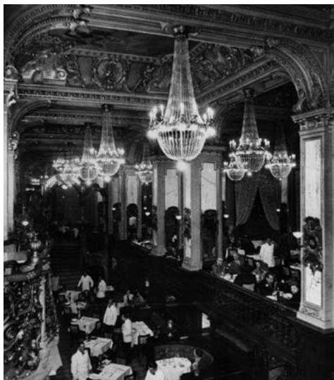
A New York az 1930-as években

IMPRESSZUM: HETED7 Magazin - Megjelenik: 20 000 PÉLDÁNYBAN Felelős kiadó: Facultas Nonprofit Kft. 1071 Budapest Dembinszky u. 34. TELEFON: +36-30-8481704 www.heted-7.hu levélcím: info@heted-7.hu Címlapfotó: David Gapa