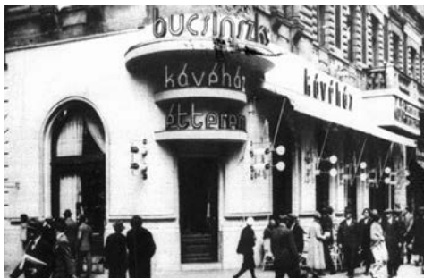
A Bucsinszky (Erzsébet krt. 30) megnyitásának évében, 1932-ben