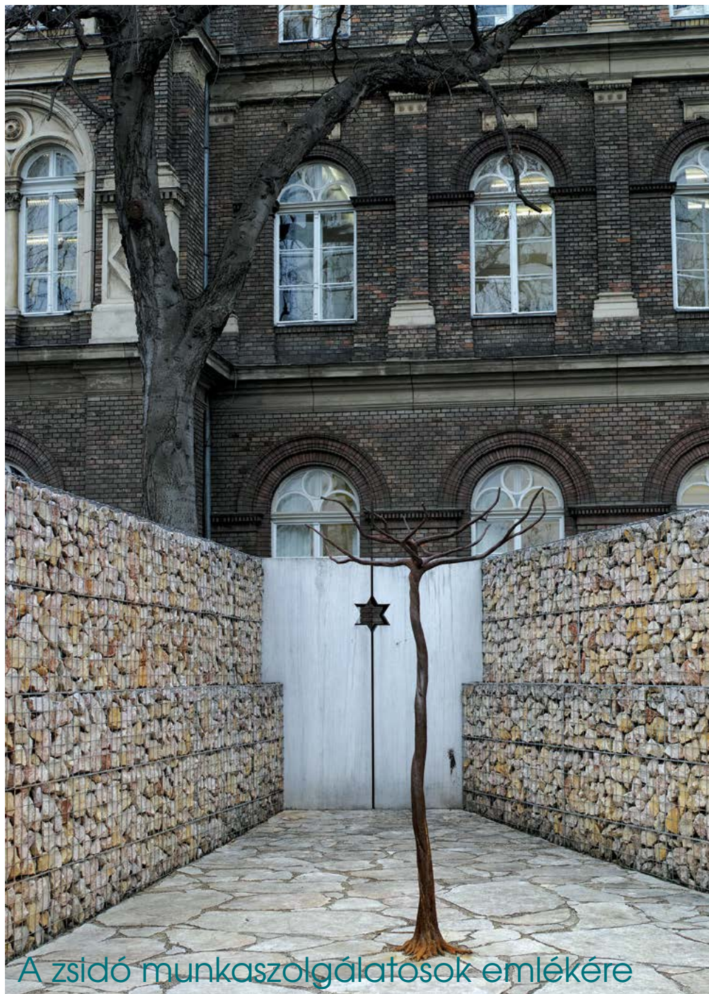
A zsidó munkaszolgálatosok emlékére