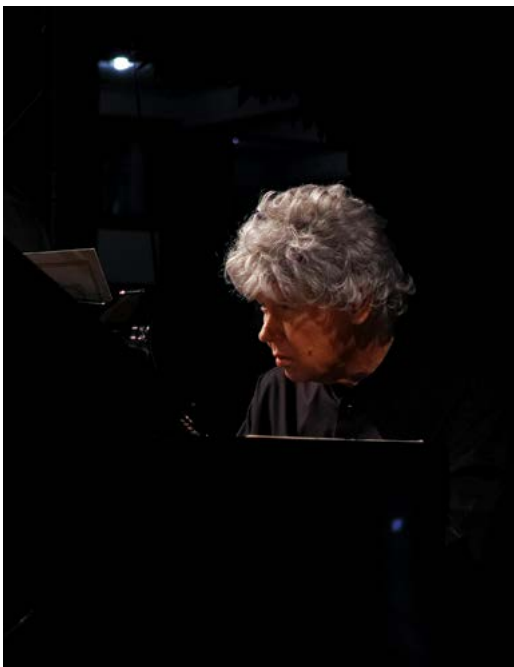
Örkény Kert, 2016