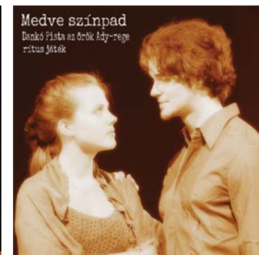
Medve színpad Dankó Pista az örök Ady-rege ritmus játék

Az előadásban elhangzó, újonnan komponált Ady dalok mellett megszólaló prózai szövegek, valamint a magyar nóta, az operett, a verbunk, a cigánynóta, a kuruc dal, ebben az „adys” közegben megemelkedve új értelmet, mondanivalót kapnak, megidézve a boldogság érzését, és a magyar szellemiséget, melyeket az előadás alatt a néző is átélhet.