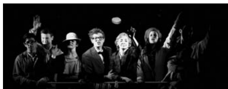
Az akadémisták a Pesti Magyar Színház darabjaiban