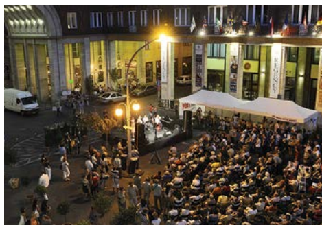
a rendezvény minden programja ingyenes

Színházunk egész napos szabadtéri rendezvénnyel, a már hagyománnyá vált Örkény kerttel köszönti az új évadot a Madách téren.